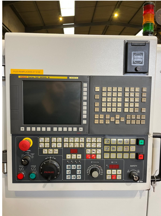
TOUR - BIGLIA - B658YS bi-broche